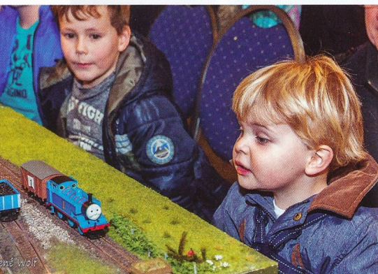
Tomas die Lokomotive ist wohl bei allen Kindern sehr bekannt